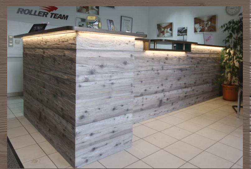
434 dunkel gehackt / dark chopped